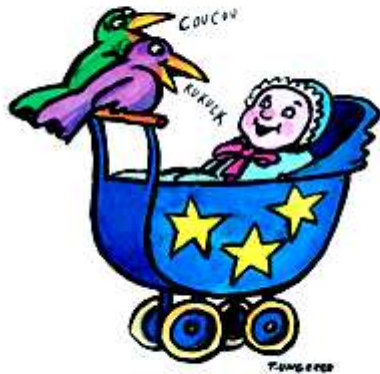
Illustration: Tang e 2002